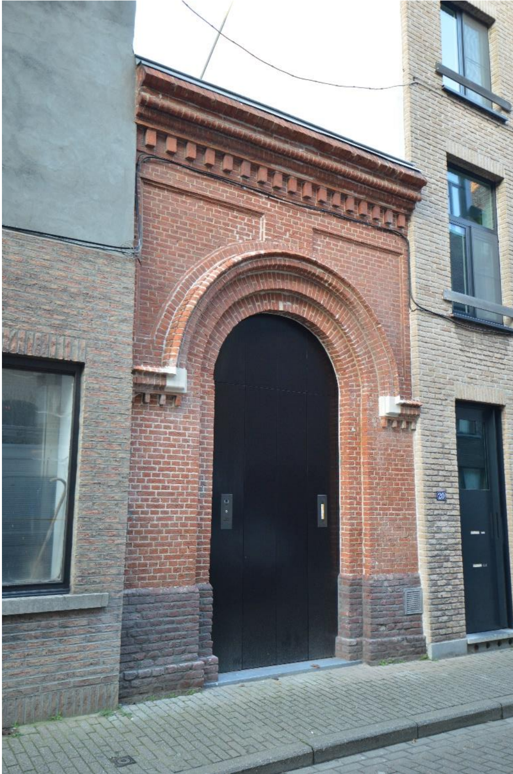
Afb 1 - Het poortgebouw in de Begijnengracht, anno 2021.