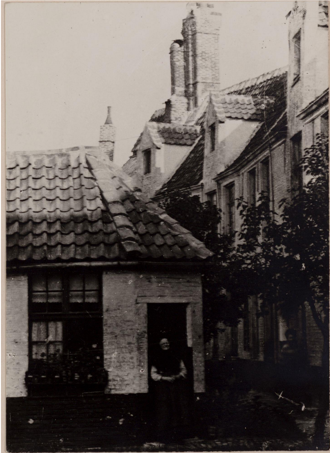
Afb 3 - Foto van circa 1890 van de gemeenschappelijke tuin van het godshuis ( beeldbank.stad.gent , SCMW_FO_0255).