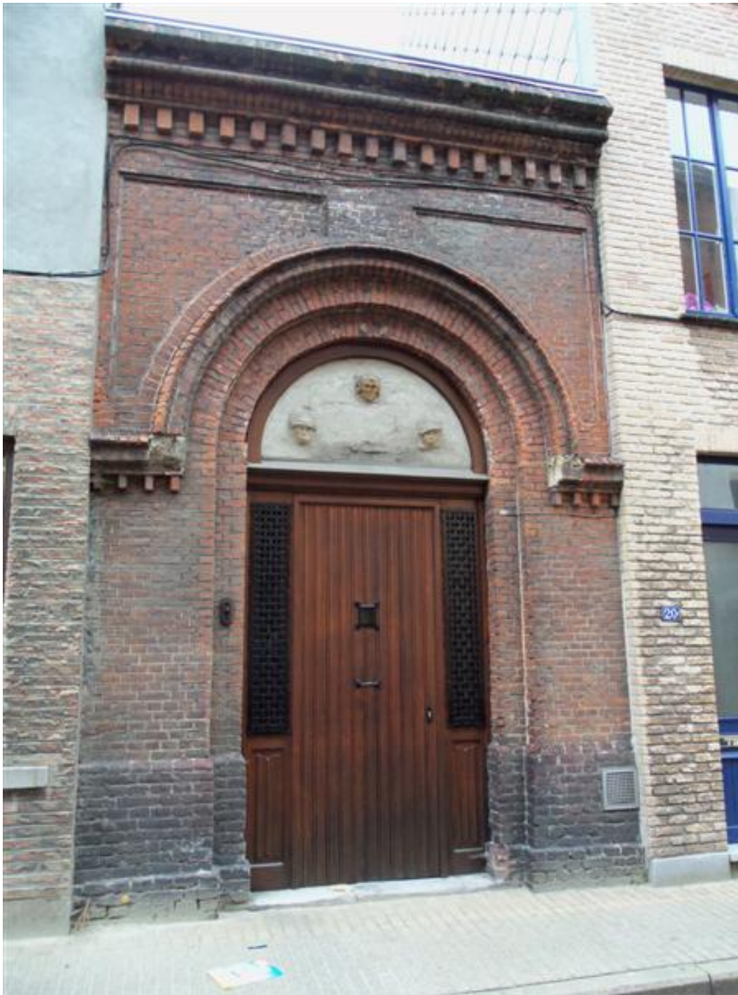
Afb 2 - Het poortgebouw in 2010, voor de restauratie (inventaris onroerend erfgoed).