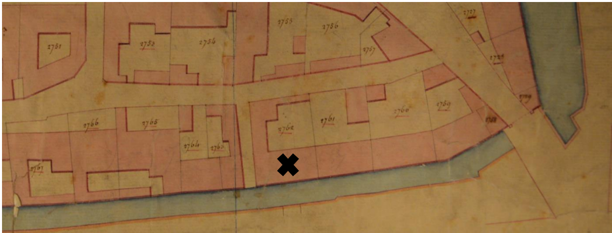
Afb 4 - Primitief kadaster van circa 1830, met aanduiding van begijnenhuis Sint-Dominicus (Kadasterarchief).